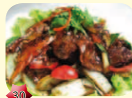
30 Ossenhaas met pepersaus