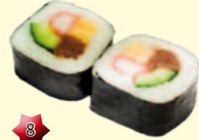
8 Futo Maki