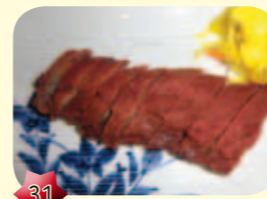
31 Cha Sieuw Geroosterd vlees