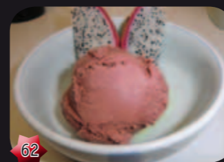
62 Red bean