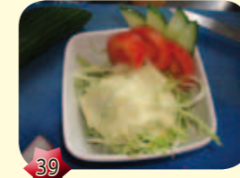
39 Japanse salade