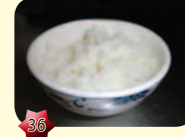
36 Witte rijst