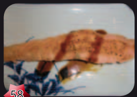
58 Sake Zalm