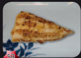
59 Suzuki Roodbaars