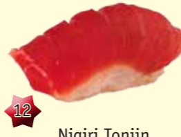
12 Nigiri Tonijn