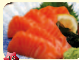
16 Sashimi Zalm € 4,50