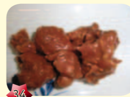
34 Indische smoorvlees