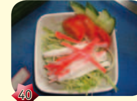
40 Krab salade