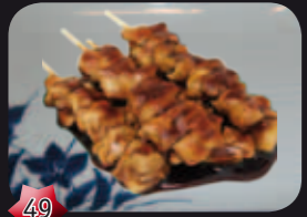
49 Yakitori Kipspies