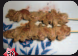
50 Kojihitsu Lamshaasspies