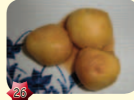
26 Toro no kanage Kipballetjes