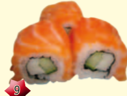
9 Ura maki