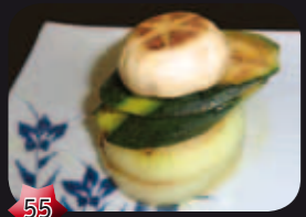
55 Yasai Mori Groente torentje