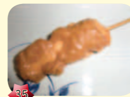
35 Sate Ajam Chicken skewer