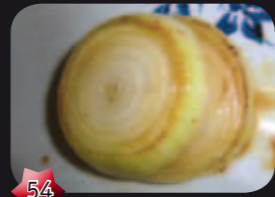
54 Yasai Uienringen