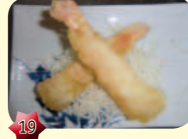
19 Ebi Tempura Garnalen