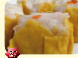
27 Sieuw Mai Vlees pasteitje