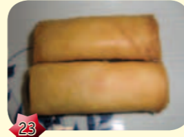
23 Tsun keun Chinese loempia's