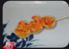
57 Ebi Garnalen spies