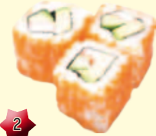
2 California Maki