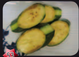
53 Zukki-ni Courgette