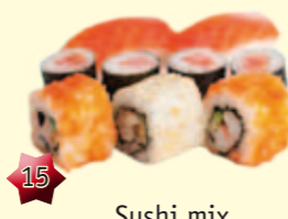
15 Sushi mix