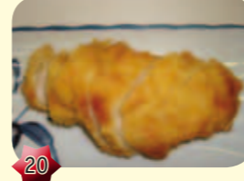
20 Tonkatsu Varkenshaas