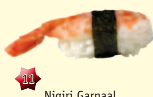
11 Nigiri Garnaal