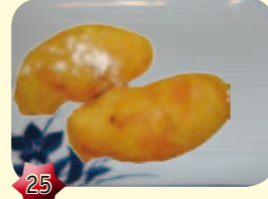
25 Gebakken banaan