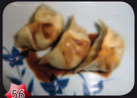
56 Gyoza Kip dumplings