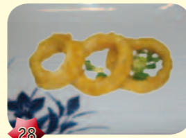
28 Ika tempura Inktvis ringen