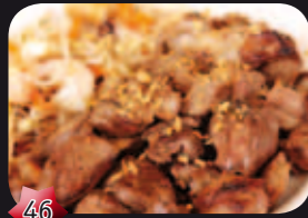
46 Gyu niku Japanse Ossenhaas