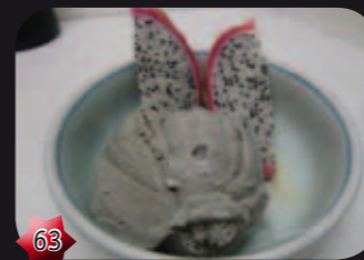
63 Black sesame