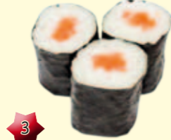
3 Hosomaki Zalm