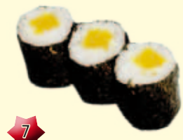
7 Hosomaki Rettich