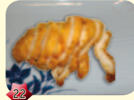
22 Kanage Tempura kip