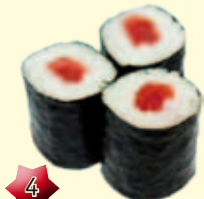
4 Hosomaki Tonijn