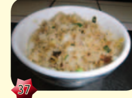
37 Gebakken rijst