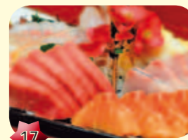
17 Sashimi Zalm/Tonijn € 4,50