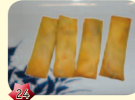
24 Chuka Haromaki Mini loempia's