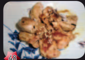
48 Tori Teriyaki kippenboutfilet