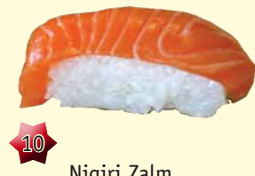
10 Nigiri Zalm