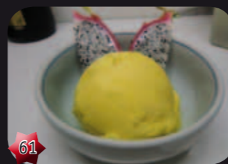
61 Yazu sorbet