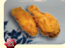
21 Tori Furai Chickenwings