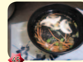
45 Miso shiro Japanse soep