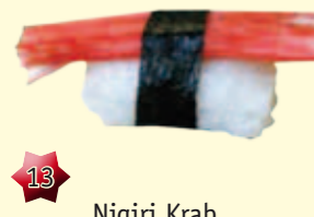
13 Nigiri Krab