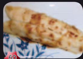
60 Shitabirame Tongfilet