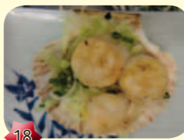
18 Hotategai St. Jacobsschelp € 4,90