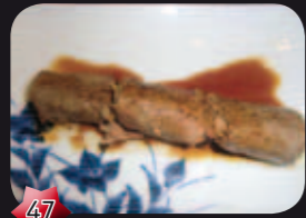
47 Ushiyaki Beefrolletjes