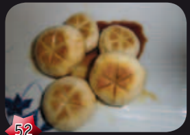
52 Kinoko Champignons