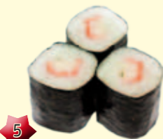
5 Hosomaki Krab