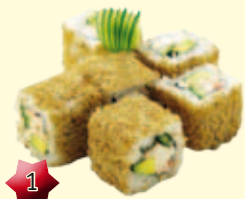
1 California Sesam