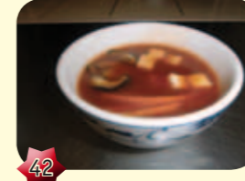
42 Szechuanseep spicy