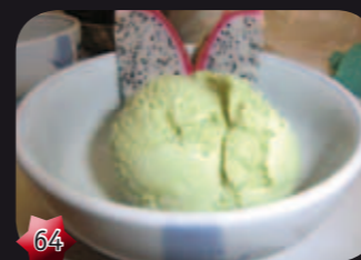
64 Green tea