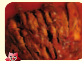
32 Babi Pangang Pork meat