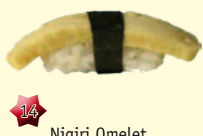
14 Nigiri Omelet