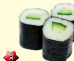
6 Hosomaki Komkommer